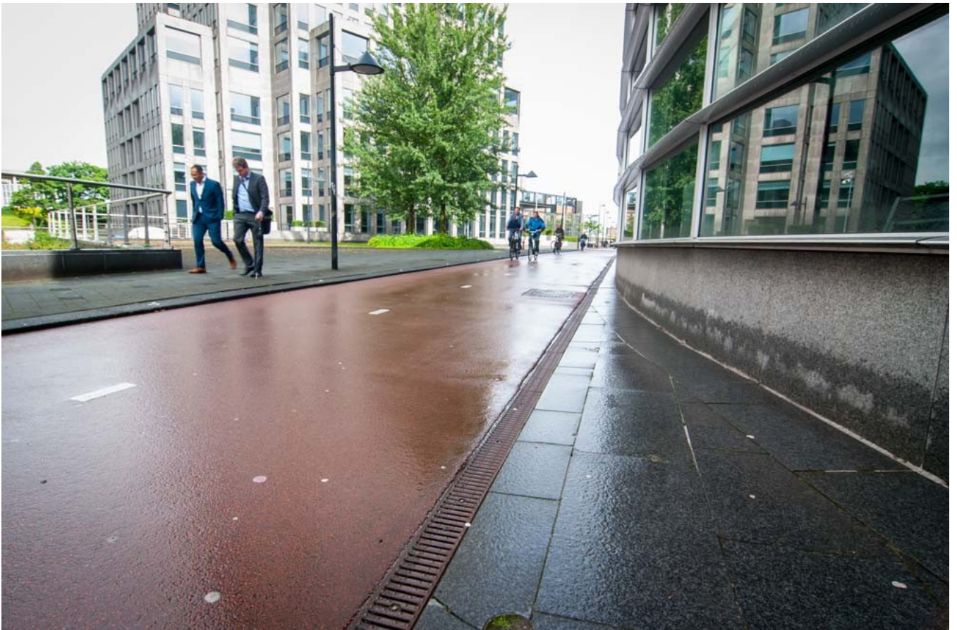
Bedekte goot Weesperzijde.