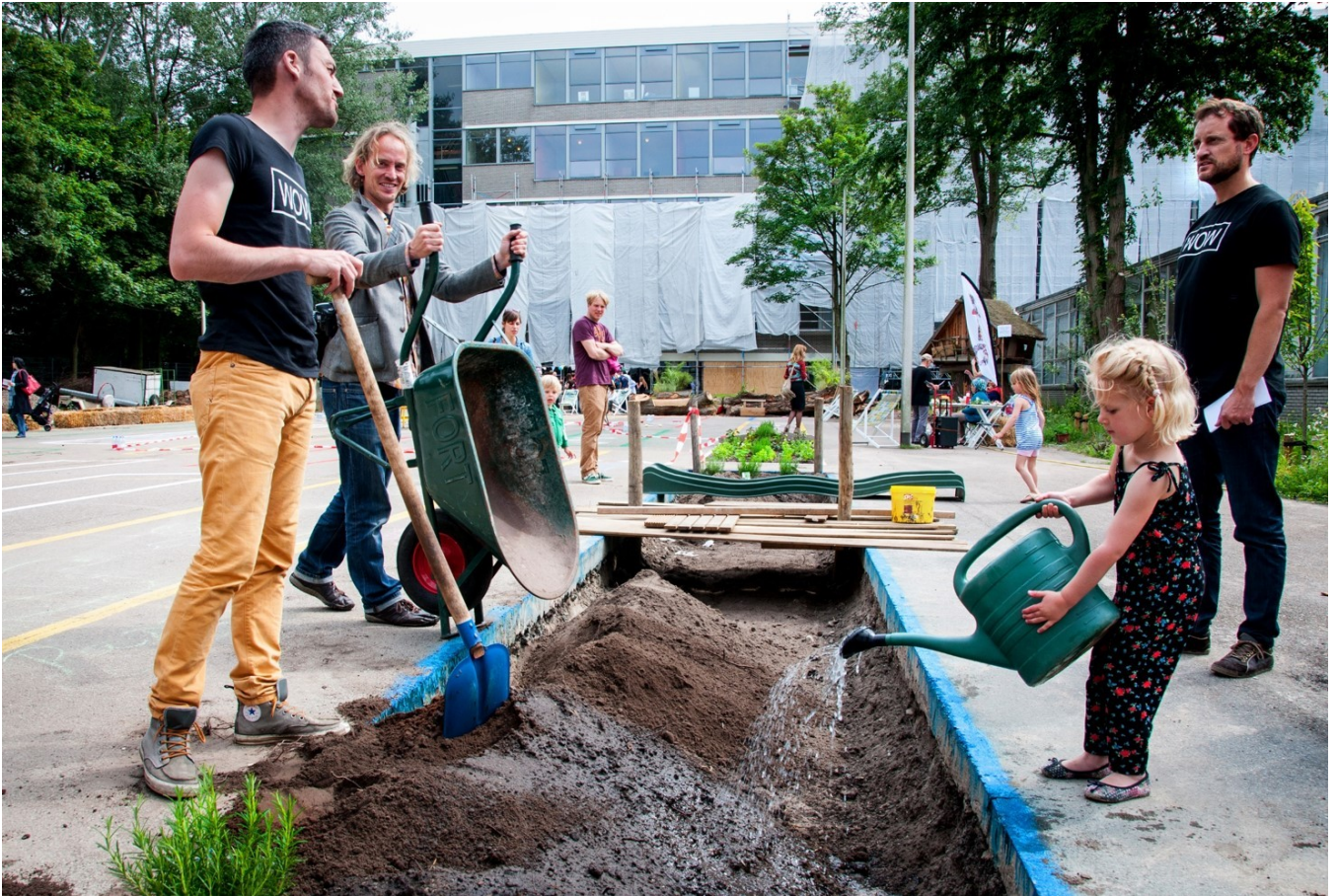
PlantageLab WOW [2].