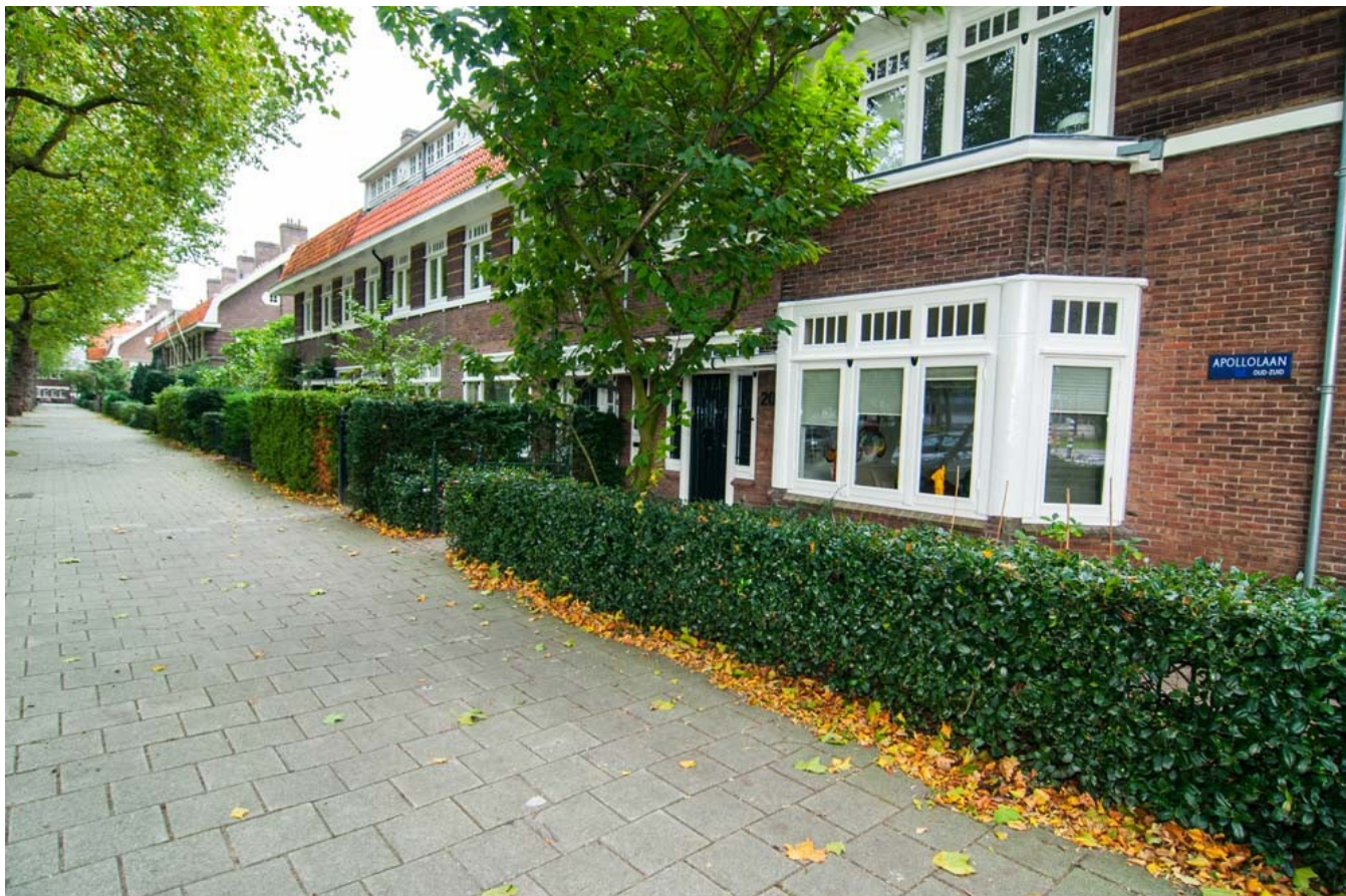
Diverse typen groene erfafscheiding in de Apollolaan.

Doordat de bladeren water verdampen, dragen hagen en struiken bij aan een koelere tuin.