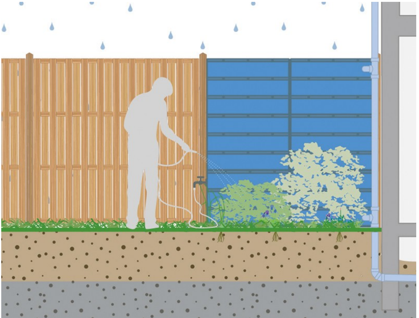
Schematische doorsnede van een regenwaterschutting. ©Atelier GROENBLAUW