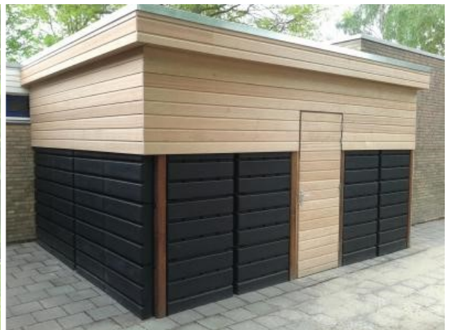
Rainwinner in de tuin en een regenwaterschuur bij een basisschool.