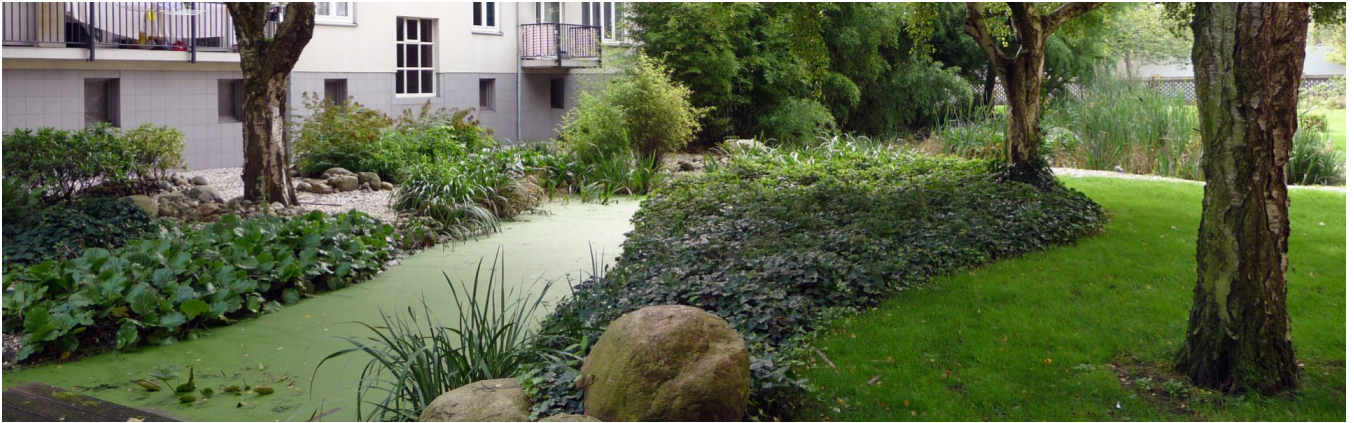
Bepanting bij een watertuin

Bepanting houdt water vast en bevordert de opname van water in de bodem. Hierdoor wordt de kans op wateroverlast kleiner. Een beplante bodem warmt bovendien veel minder op dan een verharde bodem en de planten zorgen voor extra verkoeling door verdamping. Bepanting biedt daarnaast ruimte aan allerlei ander leven.