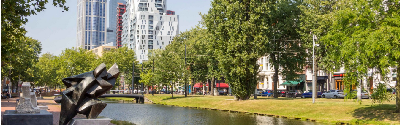
Westersingel Rotterdam

Stadsuiterwaarden zijn gebieden langs rivieren of ander oppervlaktewater. Deze uiterwaarden bergen het regenwater van omliggende gebieden dat eerst richting open water stroomt en geven zo ruimte aan het opkomende waterpeil.