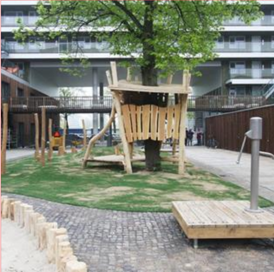
Brede school Fiep Westendorp